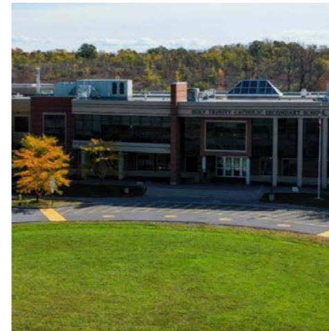
Holy Trinity - Eastern Ontario - Ontario