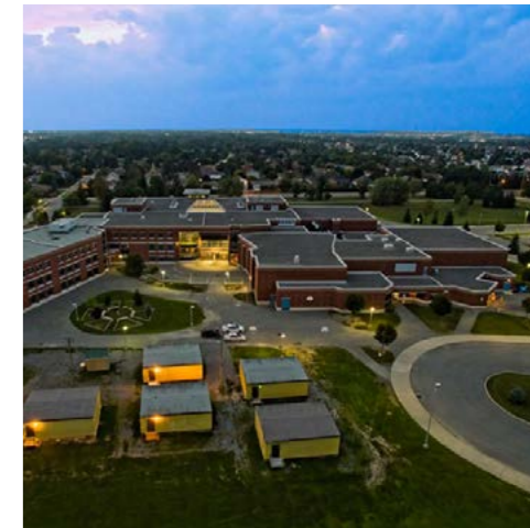
Sacred Heart Ottawa - Ontario