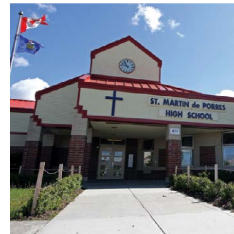
St. Martin Calgary - Alberta