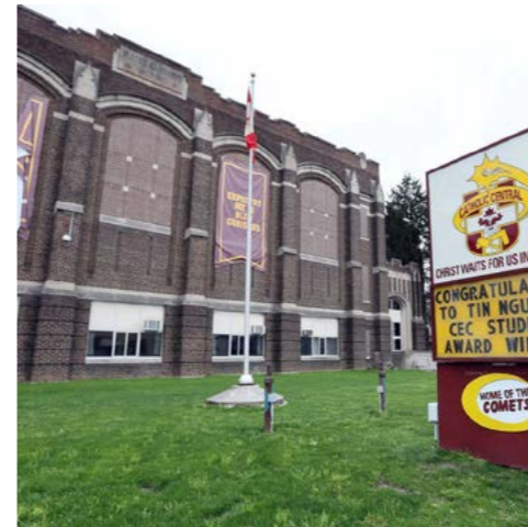
Catholic Centra Windsor - Ontario