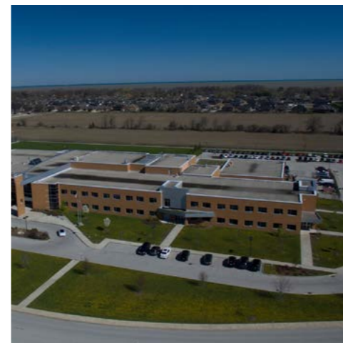
St. Anne Windsor - Ontario