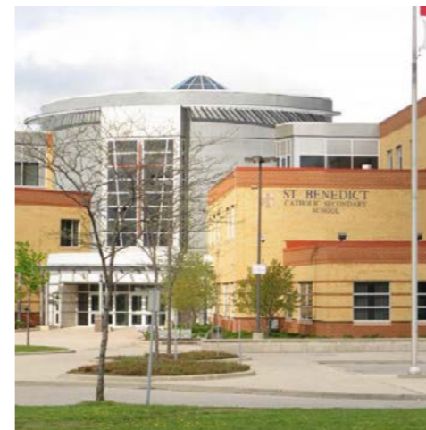
St. Benedict Waterloo - Ontario