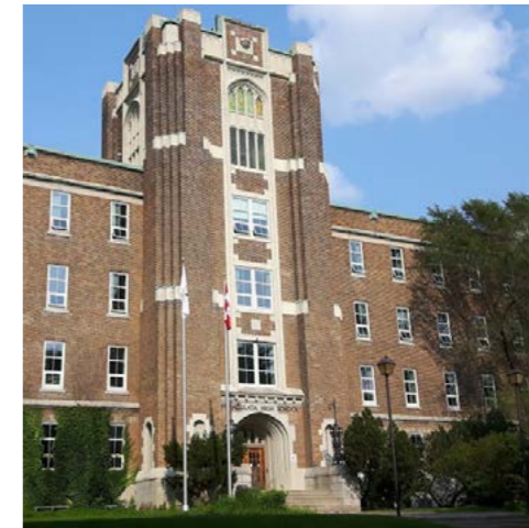
Inmaculata Ottawa - Ontario