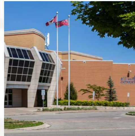
All Saints Durham - Ontario

La educación secundaria en Canadá abarca desde los 12 los 18 años.